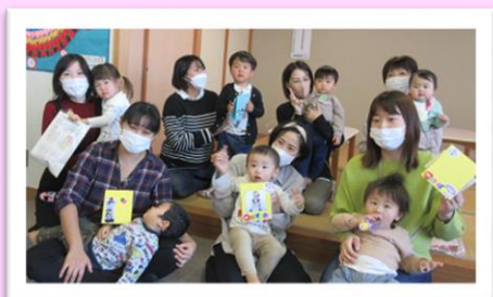
11/18 高松子育て支援センター