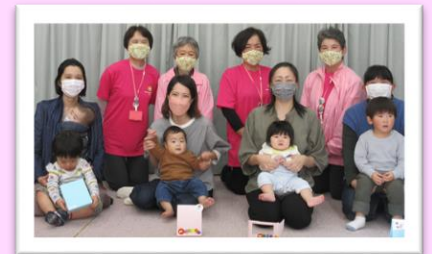
10/20 宇ノ気子育て支援センター