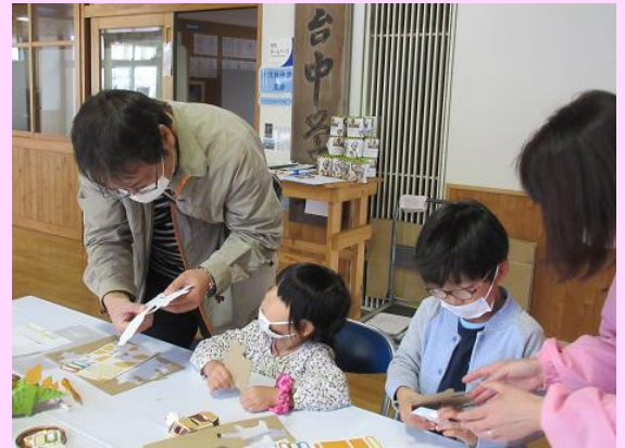
10/30 生涯学習フェスティバルにて

子ども向けお金のコーナー 貯金箱づくりを通して、みなさんとお金の大切さを学びました。