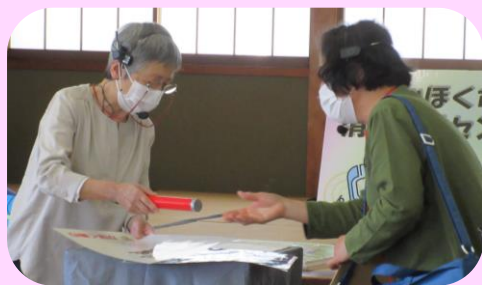
5/18 ニツ屋さわやか会