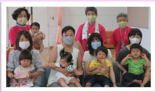
7/6 七塚子育て支援センター