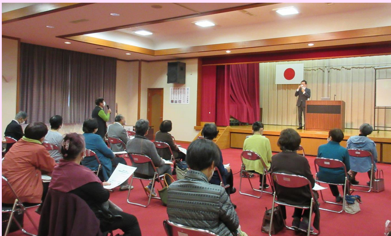
11/17 七塚健康福祉センター