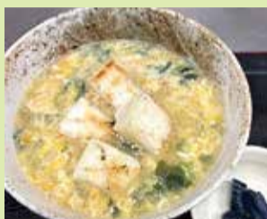
もちもち雑炊 750円 (⑦串なごみや 高松店)