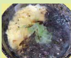
岩のりの鶏雑炊 680円 (⑲串なごみや 宇野気店)