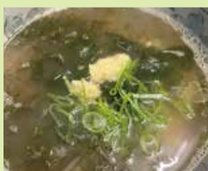
能登アカモク雑炊 700円 (⑭やきとり とんがらし)