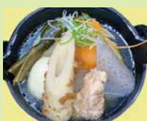
鶏だしおでん鍋(テイクアウト可) 780円 (⑲串なごみや 宇野気店)