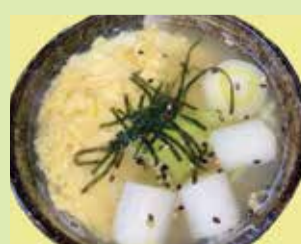
ゴロねぎたっぷり鶏雑炊 680円 (⑲串なごみや 宇野気店)