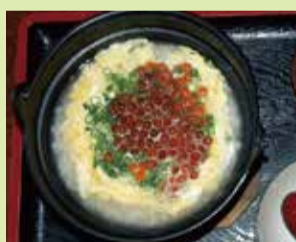
いくら雑炊 1,300円 (⑯うなぎ料理 川 義)