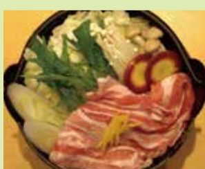
河北湯ポーク塩麹味噌鍋 1,380円 (㉑心なごみ料理 かたばみ) (お得な寿司セットは、1,000円プラスです)