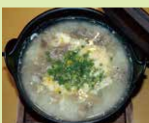
コラーゲンすっぽん雑炊 1,400円 (⑳心なごみ料理 かたばみ)