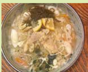
レモン雑炊 700円 (⑭やきとり とんがらし)