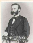
赤十字の創始者 アンリー・デュナン

赤十字の創始者であるアンリー・デュナンは、1859年6月イタリア統一戦争の激戦地ソルフェリーノの近くを通りかかり、「傷ついた兵士はもはや兵士ではない、人間である。人間同士としてその尊い生命は救われなければならない」との信念のもとに救護活動にあたりました。その「いのちを守る」想いは、今も赤十字活動の根幹となっております。