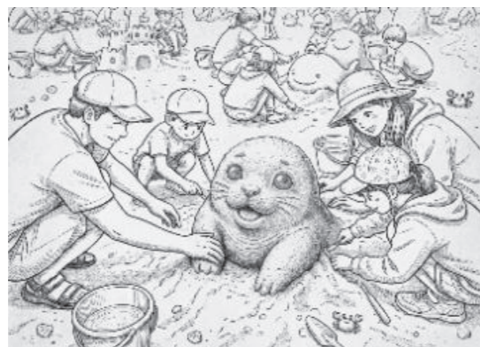
※これはイメージです