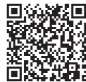
子ども地引網申込

開催日時 : 7月25日(土) 6:30 ~ 受付時間 : 6:00 ~ 集合場所 : 外日角海岸 参加対象 : 市内在住のお子様または市内でお勤めの方のお子様(中学生以下) 先着150名 ※必ず保護者の方が同伴 参加費 : 無料 申込方法 : 右記QRコードの応募フォームからお申込みください。 申込締切 : 7月20日(月) その他 : 捕れた魚は、受付先着順に配布します。 持ち帰り用の氷・クーラーボックス等は各自でご用意ください。 PFUブルーキャッツ石川かほくの選手も参加予定