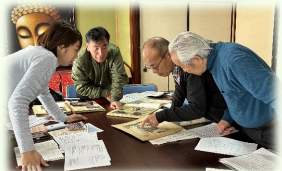
▲外日角での祭礼に関する聞き取り