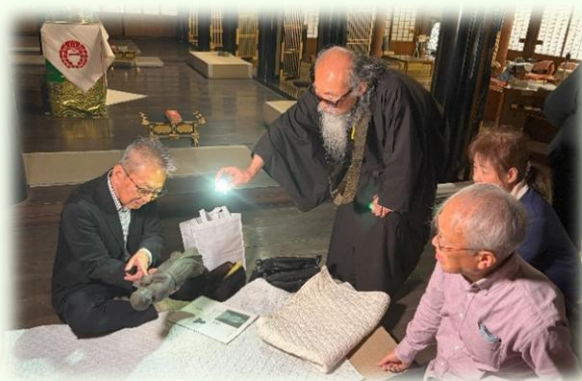
▲正楽寺（木津）聖徳太子立像の調査