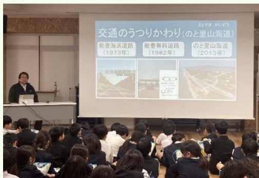
▲外日角小学校での授業の様子

3年生の社会科では「うつりかわる市とくらし」の単元で地域の簡単な歴史を学習します。今回は、図説編で掲載されている図や写真を一部使いながら、かほく市の歴史について3つの内容を伝えました。1つ目はかほく市が誕生するまでの町村合併や名称選定について、2つ目は鉄道