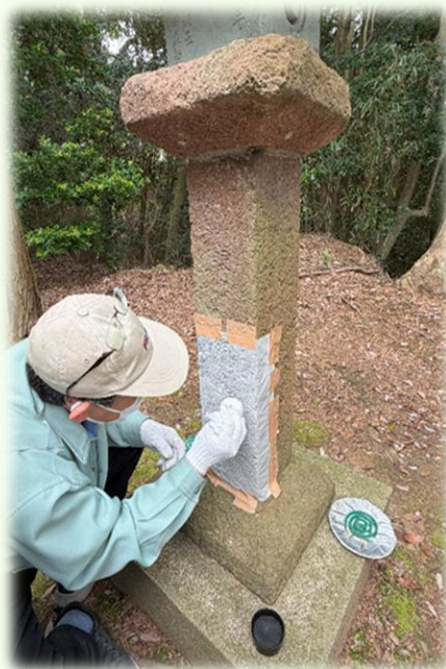
▲石灯籠の拓本を取る様子

今回、拓本を行った結果、寛延3年(1750)12月に森村の住人が寄進したことがわかりました。残念ながら寄進者の名前までは、はっきりしませんでした。関係する文献と照らし合わせながら調査を進めてまいります。