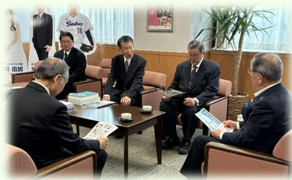
▲資料編の内容を専門委員から市長に説明

令和4年度から調査執筆活動を行ってきましたが、この度『かほく市史資料編1 古代・中世』が完成し、4月24日に油野市長へ刊行報告を行いました。本巻の特徴や購入方法につきましては編さんだよりの3ページ目をご覧ください。