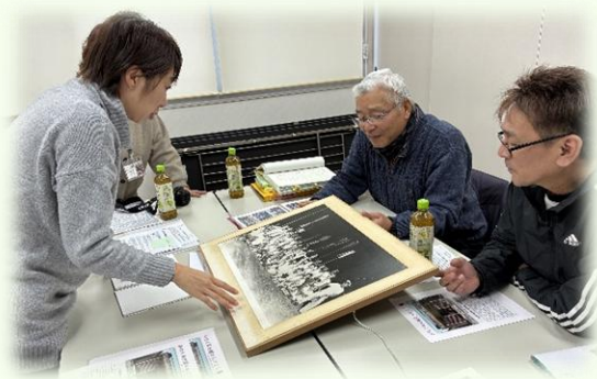
▲浜北での祭礼に関する聞き取り

また、「年中行事」の電子アンケートに対しては、105名の皆様からご回答をいただきました。ご協力ありがとうございました。その結果を生かし、さらに調査を進めてまいります。