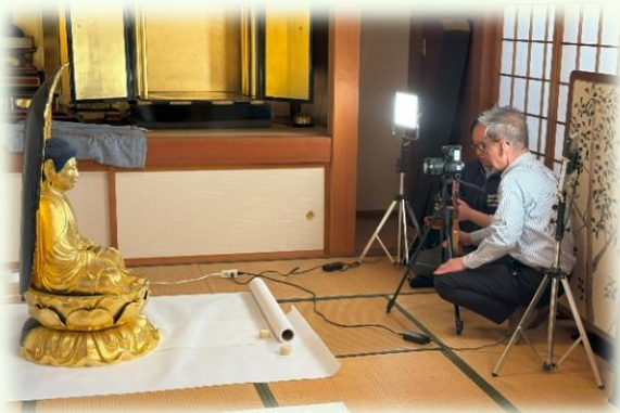
▲常行寺（横山）釈迦如来坐像の写真撮影

4月から5月にかけて市内寺院の仏像調査を行いました。調査対象は、中世までの造像および近世の造像のうち市の文化財に指定されている仏像や聖徳太子像など、特に注目される仏像としました。浄土真宗の寺院に聖徳太子の影像や仏像があるのは、聖徳太子が仏教の普及に大きく貢献したためです。市内でも聖徳太子像が安置されている寺院があり、今回はその内、5か寺の聖徳太子像を調査しました。調査結果は来年3月に刊行予定の『かほく市史資料編6 寺社』に掲載いたします。