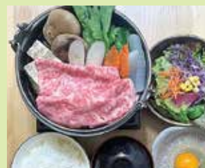
黒毛和牛のすき焼き鍋セット 2,300円 (⑩七塚食彩)