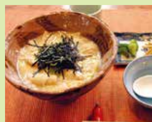
美人雑炊 700円 (⑭やきとり とんがらし)