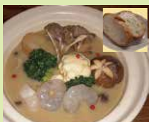
焼チーズのあったか シチュー鍋(バゲット付) (⑮食楽庵かほくさんまる)