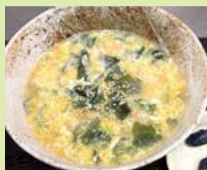
なごみや鶏雑炊 680円 (⑦串なごみや 高松店)