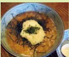
うめとろろ雑炊 700円 (⑭やきとり とんがらし)