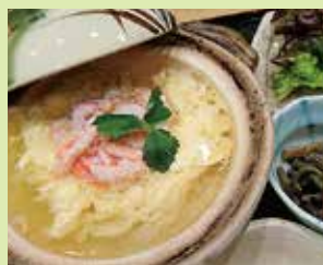
いいカニつぶり雑炊膳 (昼) 1,900円・(夜) 単品 1,100円 (③居酒屋 北 本)