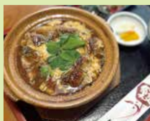
うなぎ雑炊 2,200円 (⑯うなぎ料理 川 義)