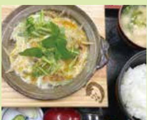
うなぎの柳川定食 2,200円 (⑯うなぎ料理 川 義)