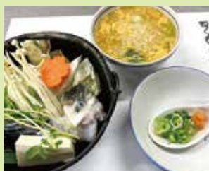
ふぐ鍋からのふぐ雑炊 (デザート・コーヒー付) 2,000円 (⑬民宿 きくのや)