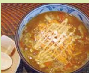
チーズカレー雑炊 700円 (⑭やきとり とんがらし)