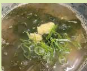
能登アカモク雑炊 700円 (⑭やきとり とんがらし)