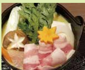
吟醸酒粕鍋 1,500円 (⑮食楽庵かほくさんまる)