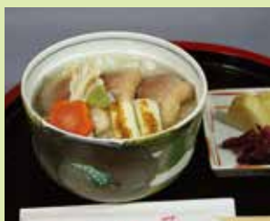
加賀の国雑炊(鴨) 900円 (④いろいろ割烹 芳(河北亭))