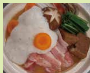
河北湯ポークの辛味噌鍋 1,500円 (⑮食楽庵かほくさんまる)