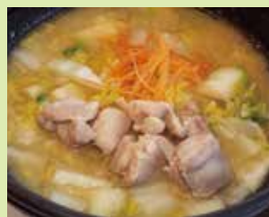
まつやのとり野菜鍋(単品) 900円 (①道の駅高松(上り線) 里山館)