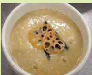
あったまる蓮根雑炊 950円 (⑮食楽庵かほくさんまる)