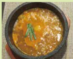
石焼チゲ雑炊 1,100円 (⑪焼肉 雅樹丸)