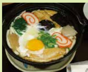
鍋焼うどん 800円 (⑥ごっつお庵 土田屋)