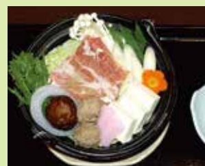
豆乳元気鍋 1,000円 (⑥ごっつお庵 土田屋)