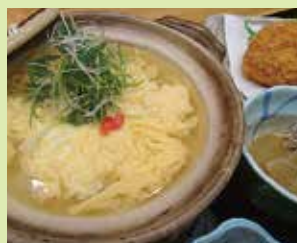
あなた想いのホタテ雑炊膳 (昼) 1,800円・(夜) 単品 980円 (③居酒屋 北 本)