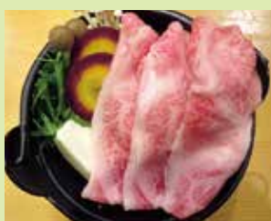
プレミアム能登牛豆腐鍋 1,380円 (㉒心なごみ料理 かたばみ)