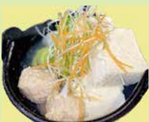
やきとり屋のつくね入り湯豆腐 980円 (⑲串なごみや 宇野気店)