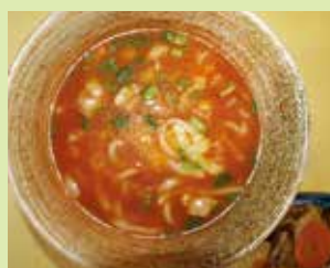
和風マトリゾット雑炊 700円 (⑭やきとり とんがらし)