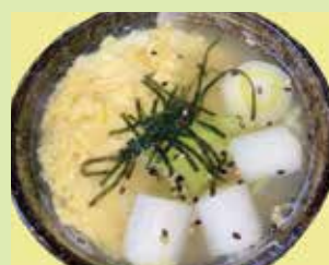
ゴロねぎたっぷり鶏雑炊 680円 (⑲串なごみや 宇野気店)