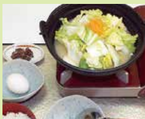
まつやのとり野菜鍋定食 (定食) 1,050円・(定食卵付) 1,100円 (①道の駅高松(上り線) 里山館)