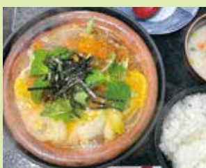
かつなべ定食 2,500円 (⑯うなぎ料理 川 義)