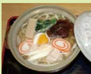
鍋焼うどん 800円 (⑱森食堂)