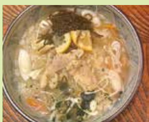
レモン雑炊 700円 (⑭やきとり とんがらし)