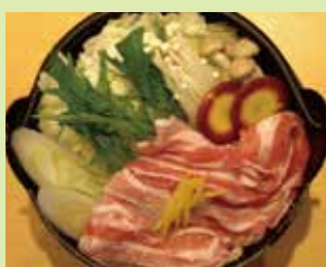
河北湯ポーク塩麹味噌鍋 1,380円 (㉑心なごみ料理 かたばみ) (お得な寿司セットは、1,000円プラスです)