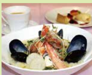
西洋雑炊ランチセット(昼) 2,400円 (⑰レストラン シェミノール)