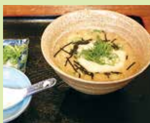
男前雑炊 700円 (⑭やきとり とんがらし)