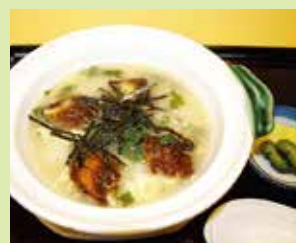
うなぎとかほつり雑炊 1,300円 (⑥ごっつお庵 土田屋)