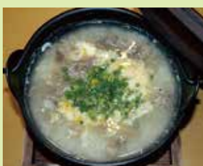
コラーゲンすっぽん雑炊 1,400円 (⑳心なごみ料理 かたばみ)