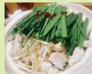
もつ鍋 1,400円 (⑨居酒屋 鶴 香)