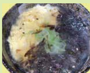
岩のりの鶏雑炊 680円 (⑲串なごみや 宇野気店)