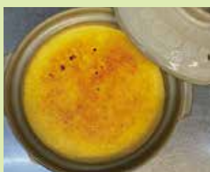
びっくり土鍋プリン 900円 (⑮食楽庵かほくさんまる)