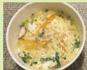
クッパ 900円 (⑪焼肉 雅樹丸)