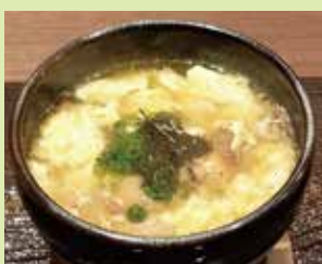
あつあつ鶏皮雑炊 750円 (⑮食楽庵かほくさんまる)