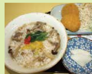
まちかど雑炊 700円 (⑤たかまつまちかど交流館)