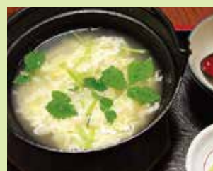
たまご雑炊 700円 (⑯うなぎ料理 川 義)