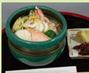
能登の国雑炊(海鮮) 900円 (④いろいろ割烹 芳(河北亭))