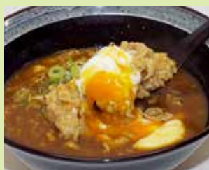
河北湯ポークのカレー雑炊 950円 (②道の駅高松(下り線) 里海館)