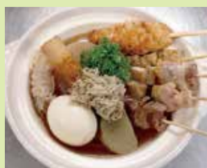
焼き鳥香るおでん鍋 1,500円 (⑮食楽庵かほくさんまる)