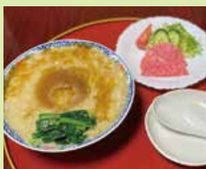
フカヒレ雑炊 1,780円 (⑧中華料理 酔神)