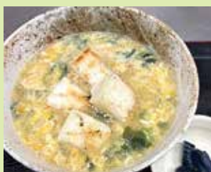
もちもち雑炊 750円 (⑦串なごみや 高松店)