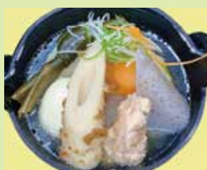
鶏だしおでん鍋(テイクアウト可) 780円 (⑲串なごみや 宇野気店)