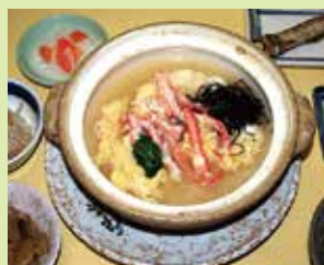
平日お昼のカニ雑炊定食 (昼) ランチ 1,200円 (⑫魚料理・民宿 やまじゅう)