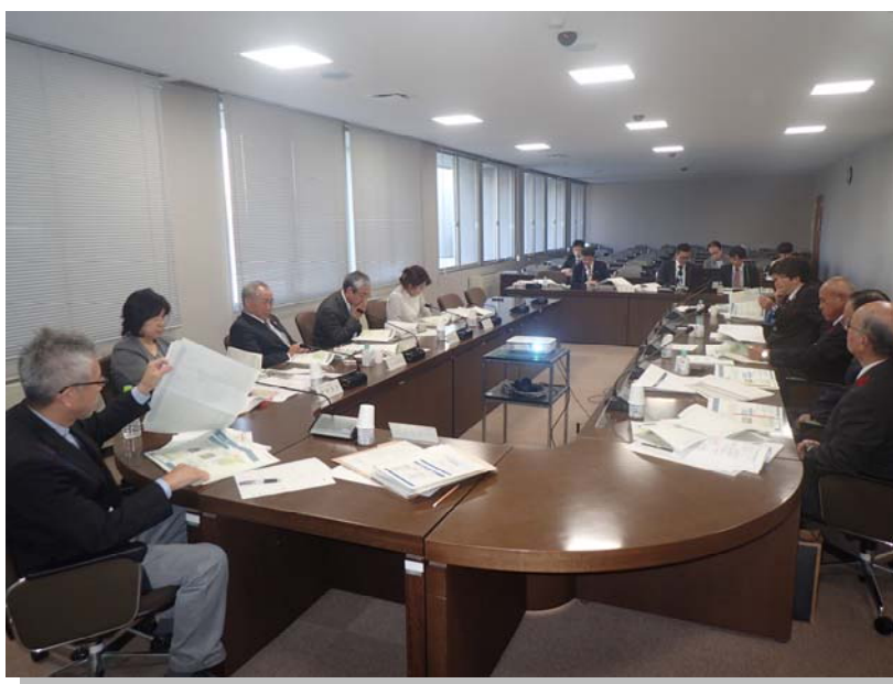
策定委員会の様子