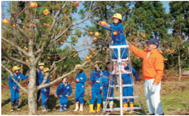
市内の小学校3年生の児童全員が紋平柿の収穫体験を行いました。

国民が生涯にわたって健全な心身を培い豊かな人間性を育むことができるよう、食育に関する施策を総合的かつ計画的に進めることを目的として、平成17年7月に施行された法律です。