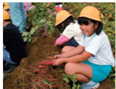
喜綿さんの畑で「かほっくり」(さつまいも)の収穫体験をする高松小学校児童

「かほっくり」の苗植えと収穫を体験してもらい、自ら収穫したものを持ち帰って食べてもらいました。体験中の子どもたちの表情は大変明るく、皆いきいきとしていました。このような体験を通して、作業の辛さ、成長の喜び、収穫の喜びを体全体で感じ、食の大切さ、尊さがわかってもら