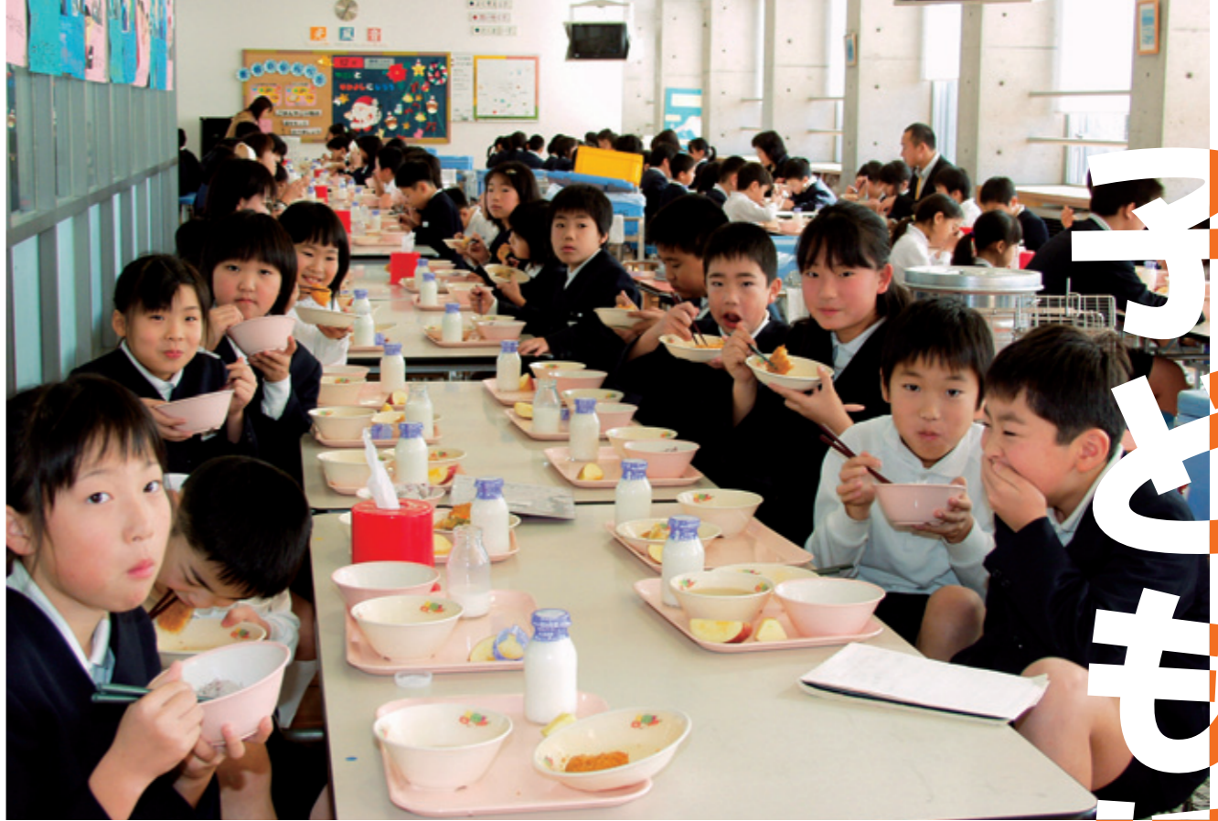
金津小学校の給食時間

金津小学校では、1年生から6年生がたてわりのグループに分かれ、ランチルームで給食を食べています。