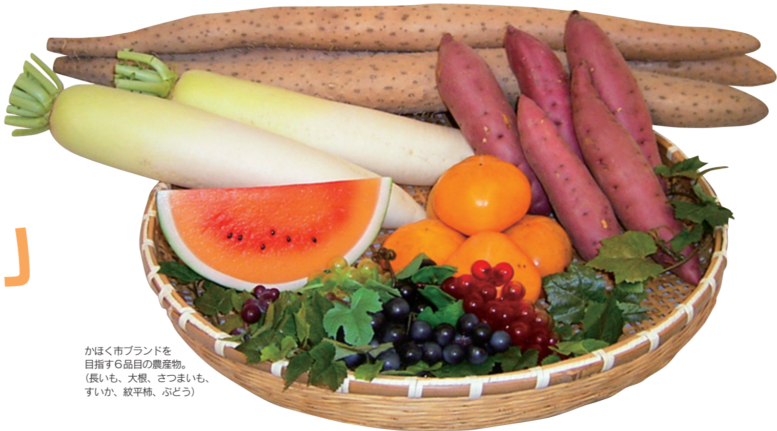
かほく市ブランドを目指す6品目の農産物。(長いも、大根、さつまいも、すいか、紋平柿、ぶどう)