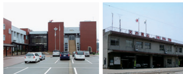
現在のかほく市本庁舎