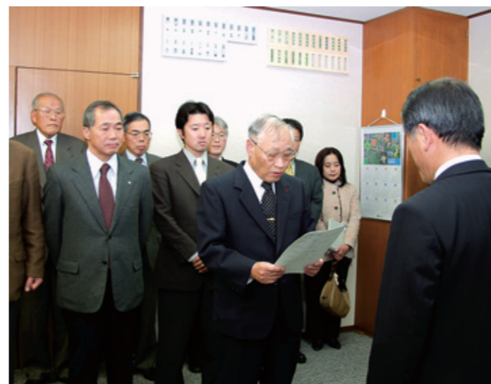
油野市長に対してかほく市庁舎整備について提言する岩佐会長(中央)