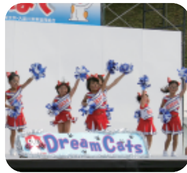
元気いっぱいだにゃん