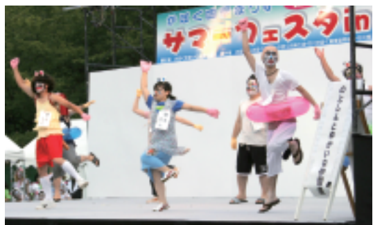
のとしんゆかいな仲間達かほく市