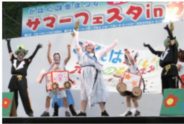
PFUもつと産み隊(かほく市)