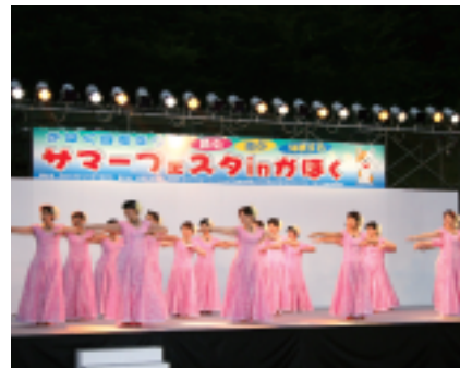
クラブレッツ「フラダンス教室」