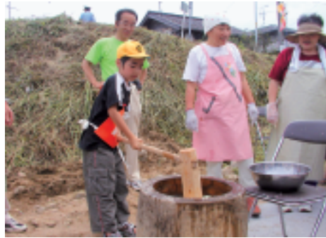
チャリティー餅つき

開催数日前からの降雨のため、大海川での開催が危ぶまれましたが、無事に夏栗橋横で実施することができました。川に鮎を放流し、440人の参加者が次々と鮎のつかみ取りを体験しました。参加者の多くは、大海川漁業協同組合員の指導の下、その場で捕まえた鮎を焼いて食べました。今年は自然体験教室として、舟流し・石ベイントが行われ、子どもたちの楽しい歓声が上がっていました。また、チャリティー餅つきや、地元瀬戸町の新鮮野菜や特産物の朝市も行われました。