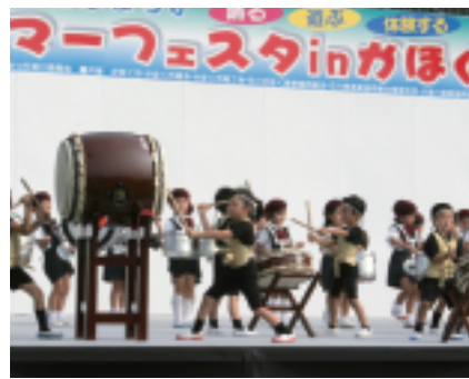
木津幼稚園の「威風堂童」

パフォーマンズが観客を楽しませました。市内スポーツクラブによるステージではラダンス教室、キッズヒップホップダンス教室、新体操教室が日ごろの練習の成果を發揮し、クラブのPRをしました。仮装部門の表彰式に続き、市民謡協会の生の唄と演奏による「かほく夢おどり」かほく四季だよりでの輪踊りが行われ、幾重にも重なる輪の中に、人も猫も一緒になって踊りに酔いしていました。