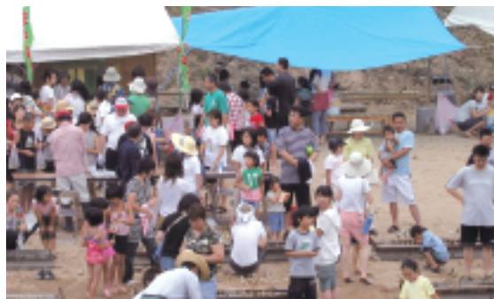
とった後は塩焼きで

開催数日前からの降雨のため、大海川での開催が危ぶまれましたが、無事に夏栗橋横で実施することができました。川に鮎を放流し、440人の参加者が次々と鮎のつかみ取りを体験しました。参加者の多くは、大海川漁業協同組合員の指導の下、その場で捕まえた鮎を焼いて食べました。今年は自然体験教室として、舟流し・石ベイントが行われ、子どもたちの楽しい歓声が上がっていました。また、チャリティー餅つきや、地元瀬戸町の新鮮野菜や特産物の朝市も行われました。