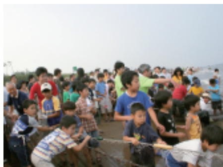
力を合わせて引け～

148人で競われました。全体的に良好な釣果で、小さいながらも数多く釣れている方が多い中、20cmを超える大物を釣っていた方もいました。