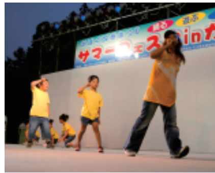
クラブパレ「キッズヒップホップダンス教室」