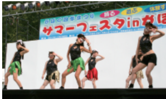
キャット・ビート(白山市)