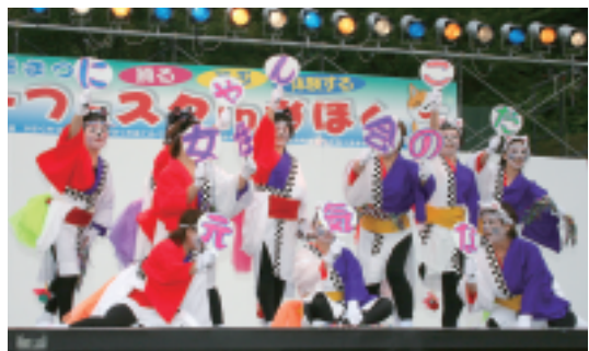
浜にゃんこ(かほく市)