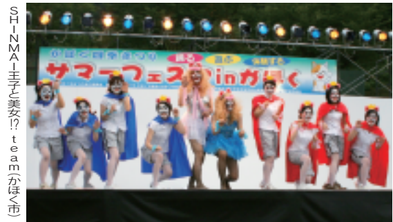
S.H.N.M.A.主予美安? teamかほく市