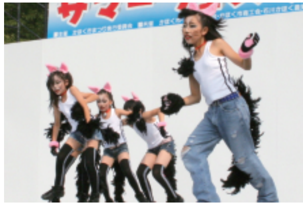
FATY・にゃんこ(金沢市)