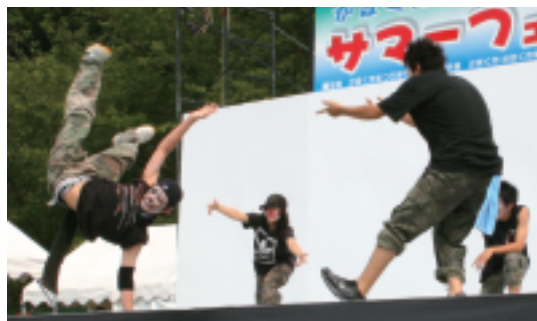
ねこさんクルー(かほく市)