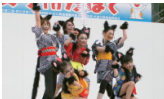
なんだかや〜ん!? (金沢市)