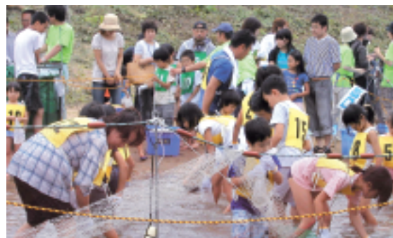
素手では難しい鮎つかみ