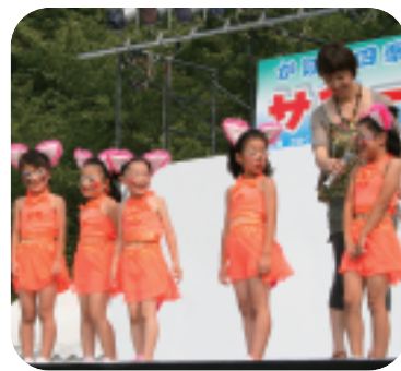
インタビューちょっとはずかし