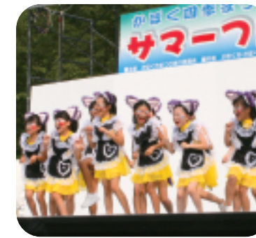
笑顔がかわいいにゃん