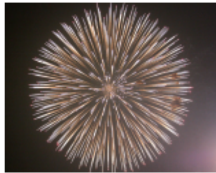
まつりの最後を彩る花火

パフォーマンズが観客を楽しませました。市内スポーツクラブによるステージではラダンス教室、キッズヒップホップダンス教室、新体操教室が日ごろの練習の成果を發揮し、クラブのPRをしました。仮装部門の表彰式に続き、市民謡協会の生の唄と演奏による「かほく夢おどり」かほく四季だよりでの輪踊りが行われ、幾重にも重なる輪の中に、人も猫も一緒になって踊りに酔いしていました。