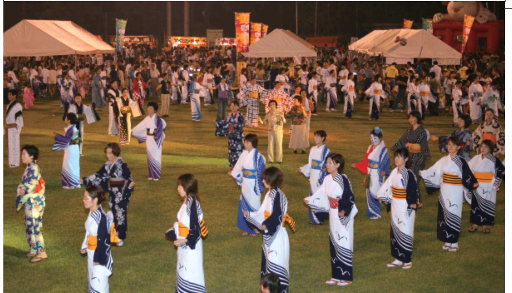
幾重にも広がった輪踊り