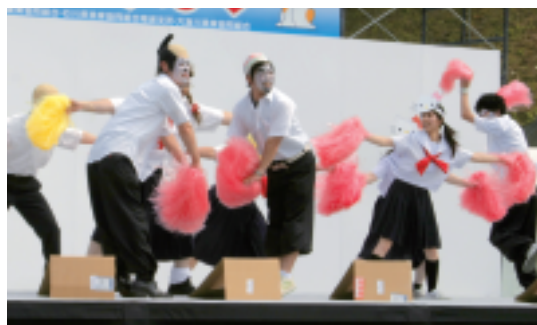
きんしん学園(かほく市)