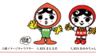
人権イメージキャラクター 人KEN まる君 人KEN あゆみちゃん