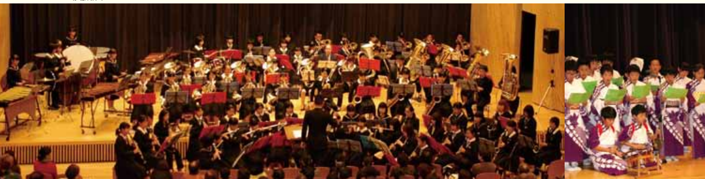
中学校吹奏楽部と市吹奏楽団による100人バンド