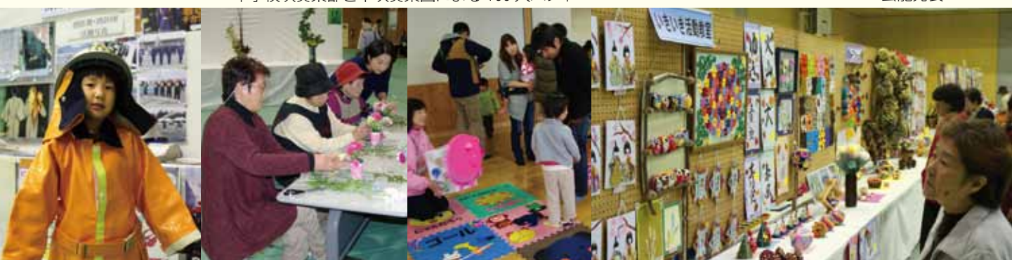
行政展示コーナー