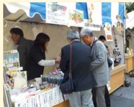
かほく市の特産品を P R

東京都京橋付近で開催された「第 43 回 日本橋・京橋まつり 諸国往来市」にかほく市が参加してきました。 首都圏で石川県を P R することを目的に、各市町の名産品のお店が出店しました。東京にしながら石川県の名産品を味わえるとあって、会場は多くの来場者で賑わいました。