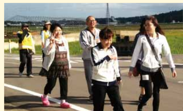
爽やかにウォーキング！

当日は、ボランティアの協力の下、総勢 52 名が 2.5 キロコース、9 キロコースに分かれウォーキングを楽しみました。参加者は、各スポットで西田幾多郎先生の業績等、観光ガイドにも耳を傾けていました。