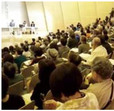
盛況の内に行われたシンポジウム