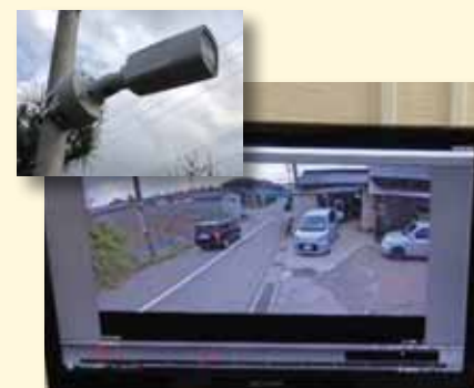
犯罪を未然に防ぎます！

全国的に防犯カメラによる犯罪抑止効果や犯罪捜査に貢献しており、今後も安全安心なまちづくりのため、設置のご協力をお願いします。