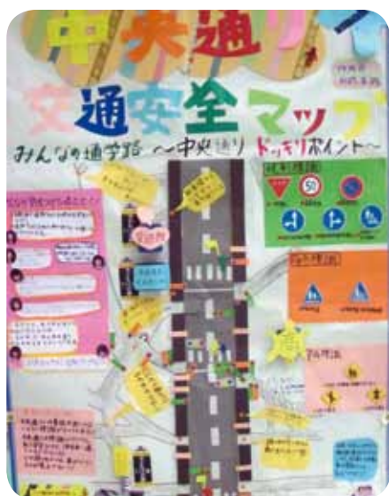
最優秀賞「中央通り交通安全マップ」（六軒町子ども会）