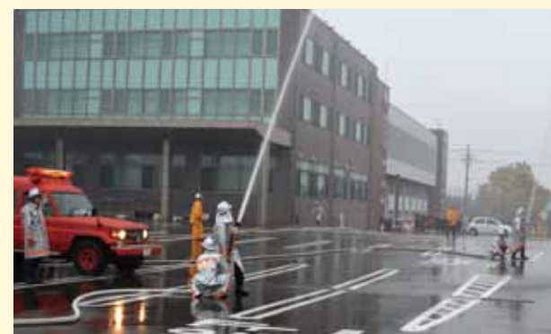
放水する消防団員

これから火災の発生しやすい時季を迎えるにあたり、火災防ぎょ活動の技術向上と、円滑な連携活動を確認し、併せて地域住民の防火思想の普及と警火心の高揚が図られました。