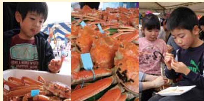
主役はやっぱりカニ！

かほく四季まつり〜かにカニ合戦 海の幸・山の幸まつり〜が七塚生涯学習センター駐車場で開催されました。 焼きガニの香ばしい香りが立ちこめる会場には、秋の味覚を味わおうと約 10,000 人が来場。市場の価格よりお値打ちとあって、来場者の中には両手いっぱいのカニを買い込む人もいました。 このほか、かほっくり、長いも、紋平柿などかほくの秋の農産物も人気で、お昼前には品薄になるほどでした。