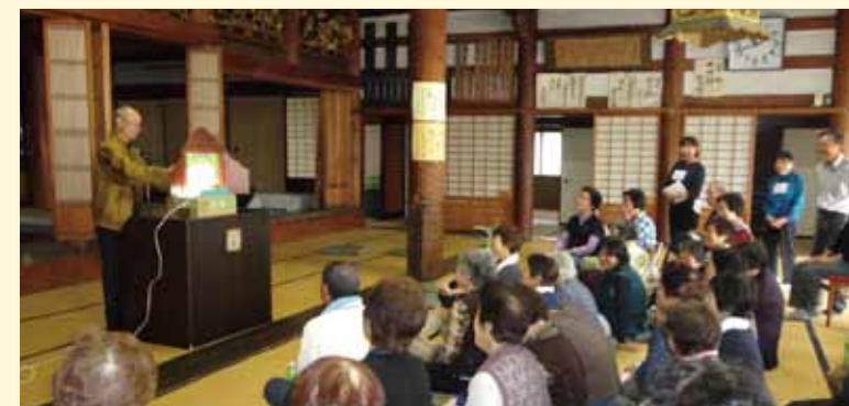
みんな楽しく「えびすの会」！

かほく市木津地区の応現寺で、月 1 回の高齢者を中心とした集いの場「えびすの会」を開催しました。 この活動は、平成 26 年度のかほく市民大学地域づくりコースより生まれたボランティア団体「チームえびす」が、「かほく市地域活動補助金」を活用して、木津地区の住民と共同して立ち上げた高齢者を中心とした集いの場です。 会には木津恵比寿町周辺の住民約 50 人が参加し、タオル体操や脳活性化レクリエーション、紙芝居、茶話会を通じて、楽しく交流できました。今後も月 1 回継続して活動していく予定です。