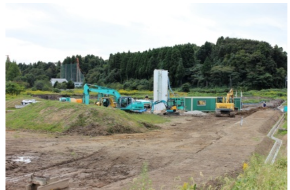
ほ場整備事業（金津地区）