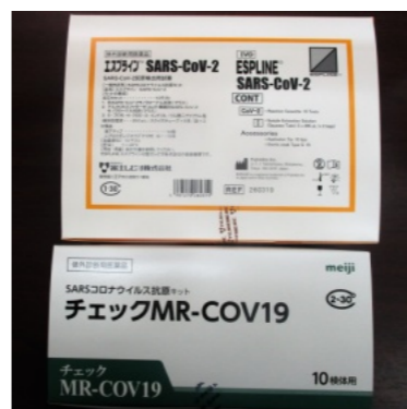
抗原簡易検査キット