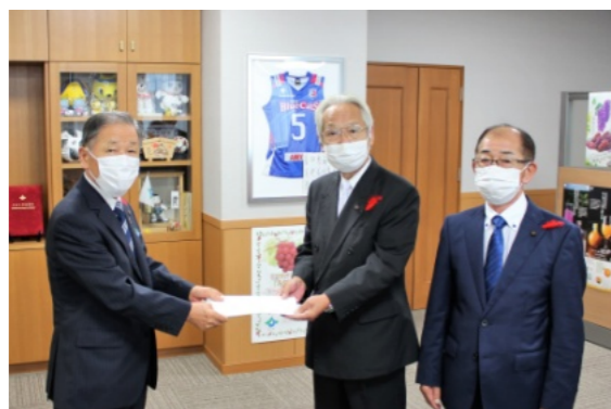
議長から市長に報告書を提出