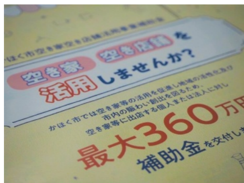
空き家・空き店舗の活用を

A 市長 1、2年目は各3件の申請があり、それぞれ事業認定。今年度は5件を事業認定している。