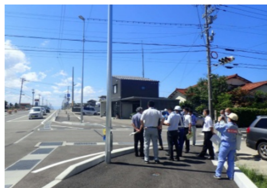
通学路の危険箇所の合同点検

指摘のあった38か所は今後、津幡警察署、国土交通省、石川県などの各施設管理者で具体的な対策を検討し、11月に市通学路安全推進協議会において実施内容を諮り、対策を進めていく。