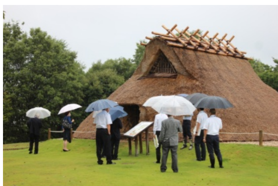
現場視察（大海西山弥生の里）