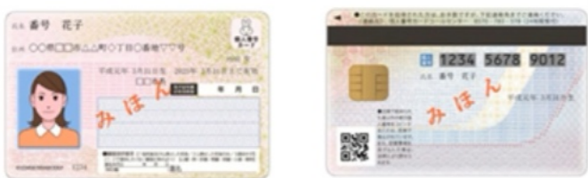
マイナンバーカード