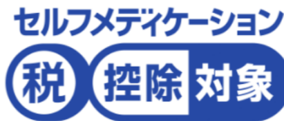
OTC医薬品の識別マーク

地方税法等の一部改正に伴い、個人住民税において、非課税限度額等における国外居住親族の取扱いの見直し、特定公益増進法人等に対する寄附金制度における寄附金の範囲の見直しや、特定一般用医薬品等購入費に係る医療費控除の特例制度、いわゆるセルフメディケーション税制の適用期限を延長するなど、所要の改正を行うもの。