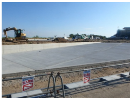
工事が進む工業用地（大崎）

Q 南部地区（内日角・大崎地区）は、河北潟周辺のため海抜も低い。高台の大崎工業用地内企業と災害時の応急活動及び防災まちづくりに貢献できる地域防災協定の締結を図れないか。 A 市民生活部長 進出企業の業態や規模など、具体的な情報や企業の意向なども踏まえ、検討したい。