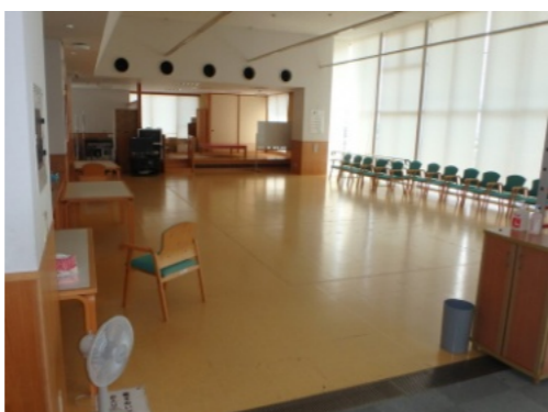
自主避難所の字ノ気保健福祉センター

Q 南部地区（内日角・大崎地区）は、河北潟周辺のため海抜も低い。高台の大崎工業用地内企業と災害時の応急活動及び防災まちづくりに貢献できる地域防災協定の締結を図れないか。 A 市民生活部長 進出企業の業態や規模など、具体的な情報や企業の意向なども踏まえ、検討したい。