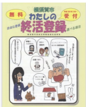
終活登録事業（横須賀市）

A 健康福祉部長 本市では、終末医療の現状や人生の最後にあたり自分の意思表示の大切さを理解する機会として市民参加型の座談会や終活講座を開催してきた。 また、市の高齢者支援センターが中心となって、民生委員による見守りや社会福祉協議会との連携を行い地域で包括的に見守る体制の強化を図っている。 終活情報登録伝達事業は、都市部と違って共助の精神が残っている地方では、まだ実施する