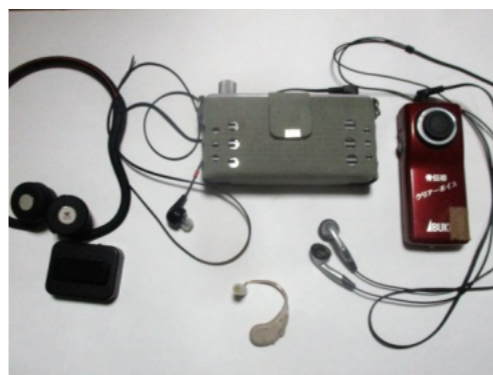
用途に応じた補聴器