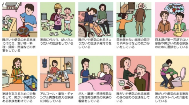
ヤングケアラーはこんな子どもたちです

今後、広報啓発に加え、子どもの人権や命を守るため、福祉、介護、医療、教育、警察など、各関係機関との連携を図りながら、潜在化しているハイリスクな世帯の早期発見、早期対応に努める。