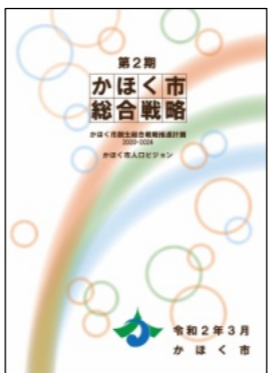
かほく市総合戦略